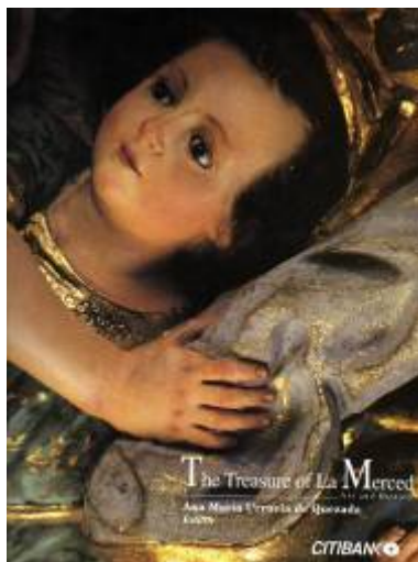
El Tesoro de La Merced A Urruela de Quezada 1997

De esta manera se elaboraron los registros de bienes de la Catedral Metropolitana de Guatemala, de la Iglesia de Santa Rosa, en Guatemala y la Iglesia de La Merced, también en Guatemala, trabajos monumentales dirigidos por la historiadora y académica Ana María Urruela de Quezada que además generaron la publicación de los libros “El Tesoro de La Merced” y “El Tesoro de Catedral” que promueven el conocimiento y valoración del patrimonio eclesiástico en Guatemala.