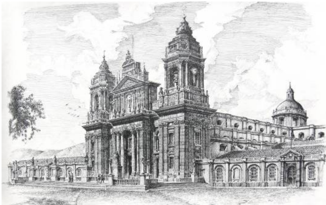
Catedral de Guatemala a finales del siglo XIX. G. Aguirre